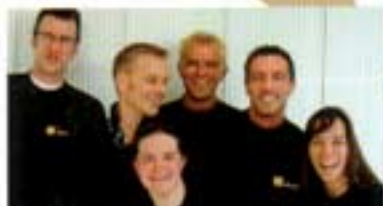
POLAR OwnZone® Ausbildungsteam Spezialisten für Herzfrequenz kontrolliertes Training